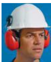
Casque anti bruit